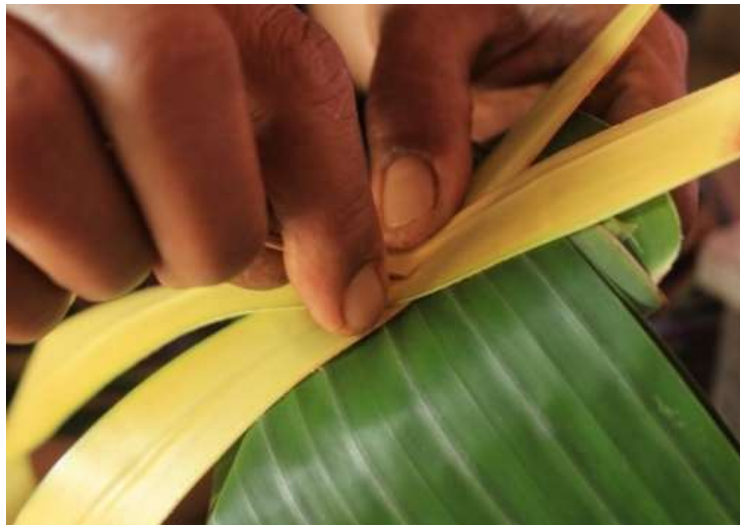
Gambar 3. Janur kuning

Janur kuning telah membawa pemahaman bagi masyarakat setempat untuk saling menjaga bukan hanya pada sesama muslim yang wajib dilakukan, namun juga ikut mengayomi kepada agama lain, bahwa Islam mengajarkan untuk saling berbagi, menyayangi dan menghormati satu sama lain. Hal inilah yang memperkuat masyarakat setempat untuk saling bertekad menjaga satusama lain.