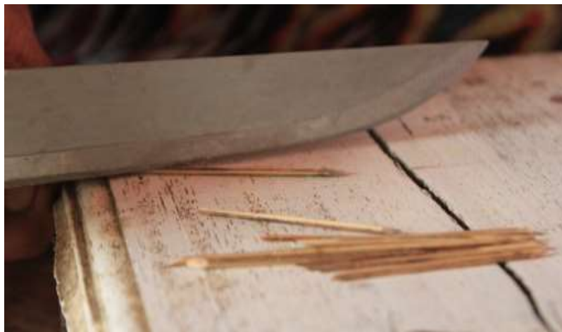
Gambar 2. Sodo atau lidi

Secara aspek psikologis, masyarakat RT 14 Kelurahan Padang Serai kota Bengkulu, memaknai sodo bukan sebagai hal mistik, sesuai dengan filosof yang dikemukakan tokoh adat setempat bahwa dalam pemikiran Jawa Kono menganggap bahwa sodo yang digunakan sebagai memperkuat takir (tempat makan) melambangkan ikatan dua kalimat syahadat yang memberikan kedamaian dan keberkahan dalam Islam. Namun, makna sodo ini kurang diterapkan dalam kehidupan dalam masyarakat disisi setempat terutama yang mengikuti ritual tersebut tidak memperkuat aqidah sebagaimana syahadat yang menjadi rukun iman pertama dalam Islam. Fenomena dilapangan masih banyak masyarakat yang tidak melaksanakan sholat, bahkan kerap meninggalkan sholat jum'at. Jadi secara psikologis makna sodo yang dimaknai syahadat belum di aplikasikan dengan baik bagi masyarakat tersebut.