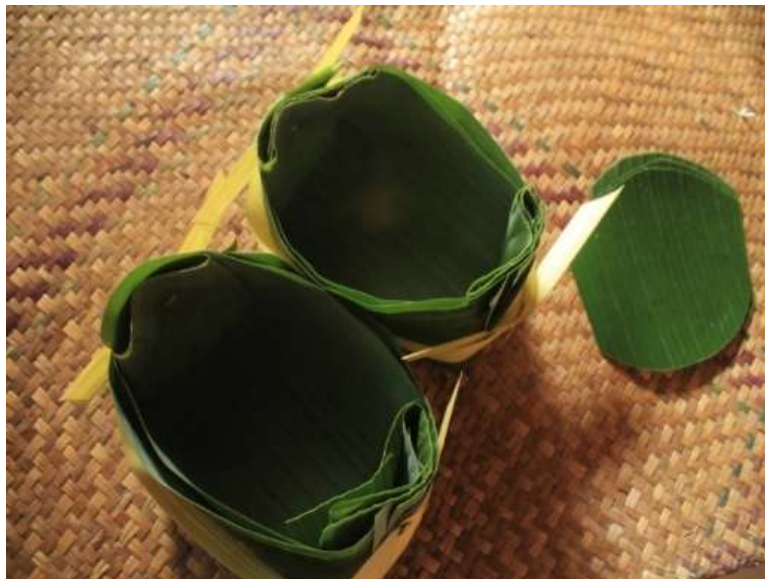
Gambar 1. Takir Pelontang

Secara aspek psikologis, pemaknaan Ritual Suroan dalam komponen Takir Pelontang ini disepakati masyarakat setempat, dan mempercayai bahwa adanya keterikatan satu sama lain dalam masyarakat tersebut untuk menjaga kerukunan, kedamaian dan keberkahan dalam kehidupan. Hal ini ditandai dengan antusiasme masyarakat setempat yang semangat membuat nasi beserta lauk pauknya untuk berbagai kepada sesama pada saat ritual berlangsung.