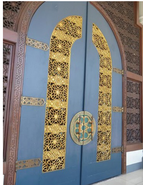
Gambar-5. Dekoratif Daun Pintu Jendela Masjid Al-Akbar, Surabaya

Secara umum, kondisi ini hampir sama dengan bentuk ornamen interior masjid jaman dahulu. Dimana bentuk ukiran dan kaligrafi banyak sekali menjadi penghias masjid-masjid besar di tanah air. Beberapa bagian yang umumnya dihiasi dengan ukiran dan kaligrafi adalah pintu, hiasan dinding di atas yang sering di ukir dengan kaligrafi, podium, dan beberapa elemen yang sering kali menghiasi masjid-masjid tempo dulu.