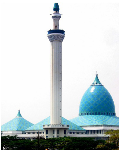
Gambar-1. Menara Masjid Al-Akbar, Surabaya https://www.google.co.id/search?masjid+agung+surabaya

Salah satu masjid yang cukup terkenal di Surabaya adalah Masjid Agung Al-Akbar yang mempunyai menara masjid dalam rancangannya menara tadinya berjumlah 6 buah ini menggunakan bentuk geometris dengan pola-pola dekorasi geometri sederhana pada dindingnya.