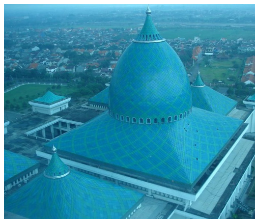
Gambar-2. Kubah Masjid Al-Akbar Surabaya Surabaya https://www.google.co.id/search?masjid+agung+surabaya

representasi simbolis yang khas. Dekorasi interior kubah sering menekankan simbolisme ini, menggunakan motif geometris, stellate atau vegetal yang rumit untuk menciptakan pola yang menakjubkan yang dimaksudkan untuk membuat kagum dan menginspirasi.